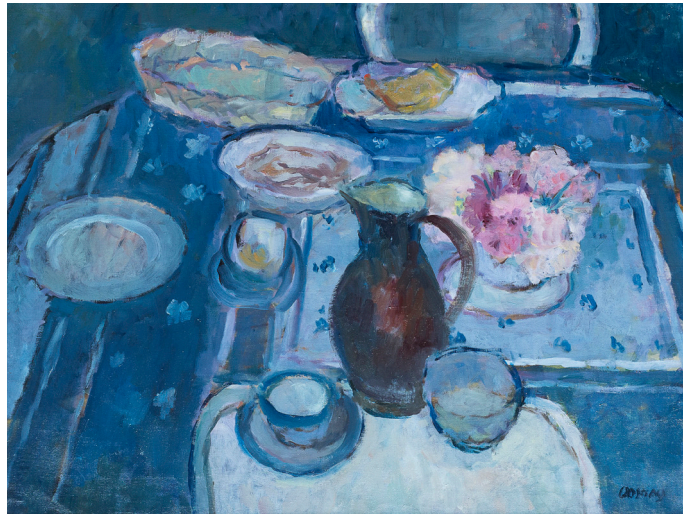
Jeanne Bieruma Oosting, Stilleven in blauw, 1981, olieverf op doek, kunstbezit gemeente Maassluis / Museum Maassluis